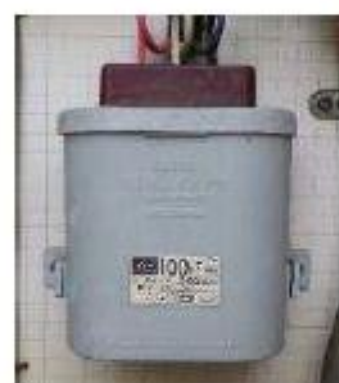
小型コンデンサー